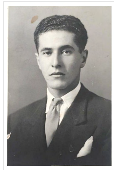
Figura 1. Dr. Antonio Ucrós Cuéllar (Bogotá, 28 de octubre de 1919 – Bogotá, 26 de septiembre de 2005).

Realizó sus estudios de Medicina en la Universidad Nacional de Colombia, donde obtuvo, en 1948, el título de médico cirujano con honores, sustentando la tesis Biopsia del endometrio en la hemorragia uterina funcional . Durante su formación, mostró inclinación hacia la